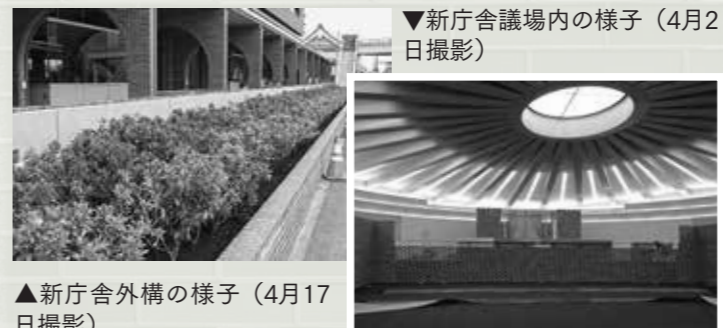
▲新庁舎外構の様子(4月17日撮影)