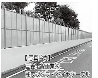
▲ブロック塀の改修事例。いずれも下の写真が改修後の写真です。