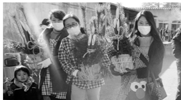
▲昨年行われた『門松づくり』の様子