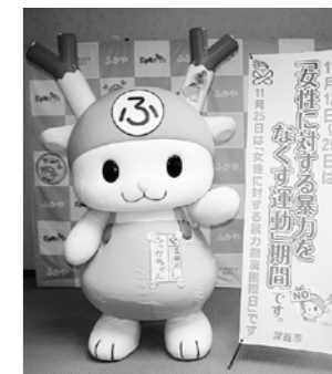
▲市役所本庁舎内などには、運動期間PRのためスタンドパネルを掲示しています。

運動期間中、キララ上柴（アリオ深谷3階）ロビーでデートDVに関するパネル展を開催します。ぜひお越しください。