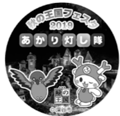
▲あかり灯し隊参加記念缶バッジ

ところ ふかや緑の王国 問い合わせ 11月12日(火)から電話でふかや緑の王国へ