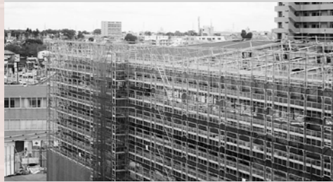
▲現在の工事の様子（10月20日撮影）