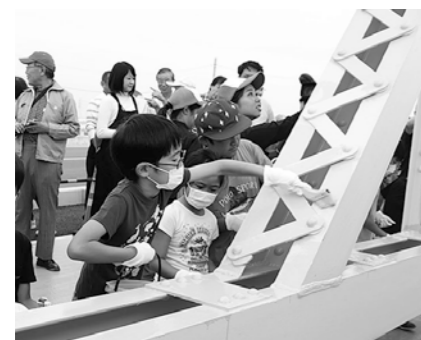
▲9月28日に地元の子どもたちを招いて行われた、上武大橋モニュメントの塗装イベント。

語り継ぐ会の皆さんがそれぞれの思いを持って作り上げたモニュメントは、現在の上武大橋の深谷市側で見ることができます。