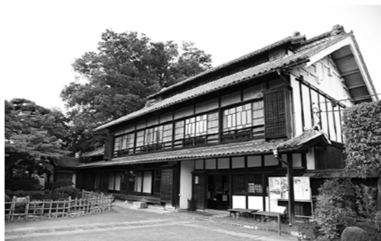
▲2体目のアンドロイドを設置する旧渋沢邸『中の家』（血洗島247-1）