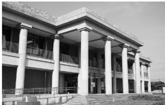
▲1体目のアンドロイドを設置する『渋沢栄一記念館』（下手計1204）

設置後は、市内観光の目玉としてだけでなく、県内外の児童・生徒の社会科見学などにも積極的に活用し、栄一の生誕地「深谷」から栄一の大事にしていた精神を全国に発信していきます。