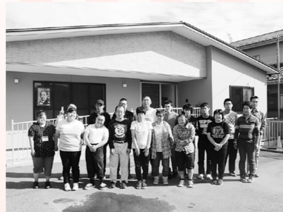
ワークーズ利用者の皆さん

「元気に、楽しく、やりがいを持って!」をキャッチフレーズにしているワークーズでは、利用者が常に社会のなかで活躍していくことをコンセプトにしています。仕事を通じて、職場、友人、家庭とさまざまなコミュニケーションを生み出していきます。