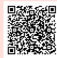
▲アプリの入手はこちらから(アプリは無料)

●全国版救急受診アプリ(消防庁作成アプリ「愛称「Q助」」) 急な病気やけがをしたとき、該当する症状などを画面上で選択していくと、緊急度に応じた必要な対応として「いますぐ救急車を呼びましょう」、「できるだけ早めに医療機関を受診しましょう」、「緊急ではありませんが医療機関を受診しましょう」または「引き続き、注意して様子を見てください」という文言が表示されます。ぜひ活用ください。