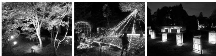
カエデ苑ライトアップ イルミネーション 小学生が描いたあかり