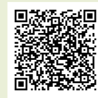
▲アプリの入手はこちらから(アプリは無料)

●全国版救急受診アプリ(消防庁作成アプリ「愛称『Q助』」) 急な病気やけがをしたとき、該当する症状などを画面上で選択していくと、緊急度に応じた必要な対応として「いますぐ救急車を呼びましょう」、「できるだけ早めに医療機関を受診しましょう」、「緊急ではありませんが医療機関を受診しましょう」または「引き続き、注意して様子を見てください」という文言が表示されます。ぜひ活用ください。