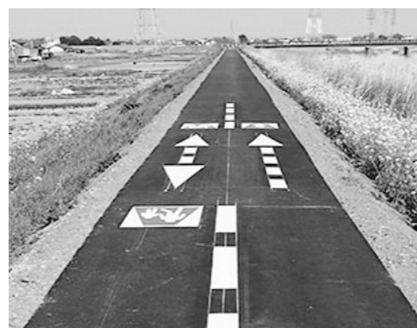
▲市内で整備が完了した小山川ウォーク&サイクルロードの様子。

であり、既に整備されている『山川遊歩道（本庄市）』や『利根川サイクリングロード』とつながることでも便利になります。皆さんも群馬の山々や小山川の素晴らしい景色を眺めながら、サイクリングやウォーキングで楽しんでみてはいかがでしょうか。 ※一部区間を除き車両は通行できません（自転車を除く）。 ※自転車のスピードの出すぎには注意しましょう。 ※利用の際は、ごみ拾いなど環境美化にご協力ください。