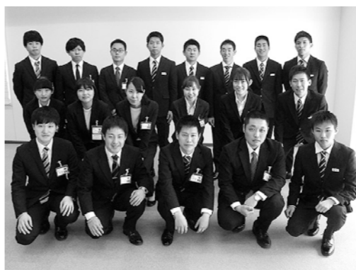
▲平成31年度新規採用職員