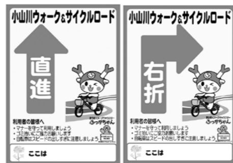
▲小山川ウォーク&サイクルロードには、ルート誘導案内（上図参照）が各所に設置されています。

県と深谷市・本庄市の協働で、小山川周辺の渋沢栄一関連施設などを中心とした史跡巡りなどの回遊性向上や、快適な散歩ルートの確保を目的として、歩行者自転車道『小山川ウォーク&サイクルロード』を令和2年度末の完成を目指して整備しています。