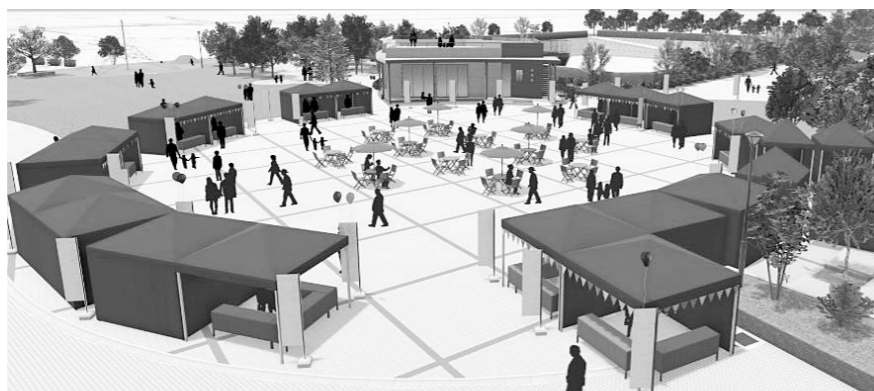
▲深谷テラスの公園緑地内イベント広場のイメージ図。

であり、既に整備されている『山川遊歩道（本庄市）』や『利根川サイクリングロード』とつながることでも便利になります。皆さんも群馬の山々や小山川の素晴らしい景色を眺めながら、サイクリングやウォーキングで楽しんでみてはいかがでしょうか。 ※一部区間を除き車両は通行できません（自転車を除く）。 ※自転車のスピードの出すぎには注意しましょう。 ※利用の際は、ごみ拾いなど環境美化にご協力ください。