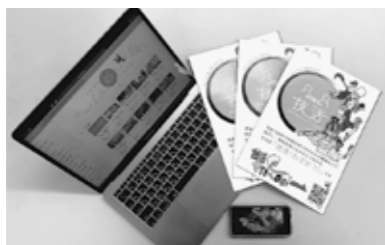
▲技活サイトはスマートフォンやパソコンなどで見られます。また『技活』登録者を紹介する冊子も公共施設で配布しています。

【登録者を募集しています】 募集分野 イラスト、音楽、エンターテインメント、趣味、スポーツなど 対象 市内在住・在勤・在学者または、市内で活動している20歳以上のかた