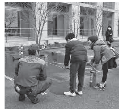
▲平成30年3月に開催した『深谷消防フェア』での消火器放水体験の様子

2019年度『スポーツ安全保険』のご案内 スポーツ安全協会埼玉支部(☎048-779-9580) 対象 ● スポーツ活動や文化活動などを行う4人以上の団体 補償内容 ● 傷害保険・賠償責任保険・突然死葬祭費用保険 ※掛け金は年齢や活動内容によって異なります。 保険期間 ● 4月1日(月)〜2020年3月31日(火) ※4月1日以降の申し込みについては、加入依頼書を郵送した消印日または払込日のいずれか遅い日の翌日から有効となります。 加入依頼書 ● 市役所本庁舎総合案内・公民館・教育庁舎・深谷ビッグスタートルで配布 ※必ず『スポーツ安全保険のしおり』または『スポーツ安全保険のあらまし』をよく読み、内容をご確認ください。