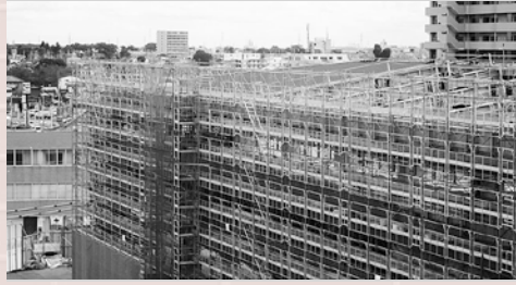
▲現在の工事の様子（10月20日撮影）