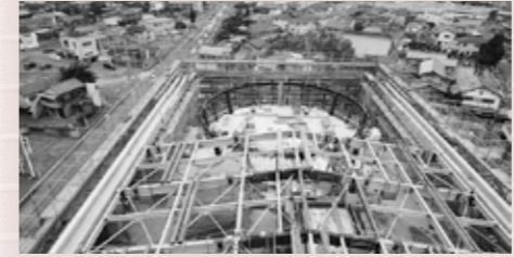
▲クレーンから屋根を撮影した様子(9月6日撮影)。外部は屋根・太陽光パネル工事、内部では壁・天井工事を進めています。

は、10月末までに通知を郵送しますので、内容を確認し、必ず手続きをしてくださいます。 ただし、児童扶養手当現況届を提出しているかたは不要です。 ※総合支所では受け付けできません。 埼玉県最低賃金 埼玉県労働局賃金室(☎048-600-6205) 埼玉県最低賃金が10月1日から時間額926円に改定されました。埼玉県最低賃金は、県内全ての労働者とその使用者に適用されます。 砂ぼこり対策にご協力を! 農業振興課(☎577-3298)