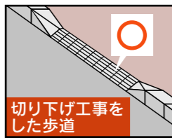
▶歩道の切り下げ工事例(良い例)