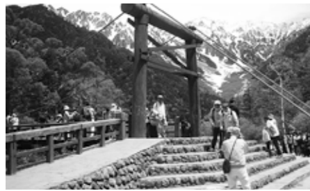
▲上高地散策ツアー

ワークメイト大里が行う、福利厚生事業のうち一部を紹介します。慶弔共済事業や補助事業など合計で40を超える事業があります。