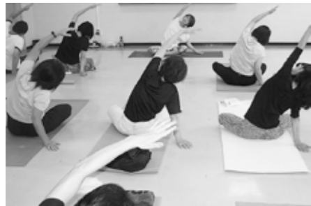
▲ゆったりヨガ教室

ワークメイト大里は、中小企業の事業所に代わって勤労者の福利厚生事業を行うため、熊谷市・深谷市・寄居町が設立した財団です。 対象 ・大里地域内の中小企業に勤務する従業員と事業主 ・大里地域以外の中小企業に勤務して、大里地域内に居住している従業員と事業主 ※事業所単位での入会を原則としています。個人での入会も可 事業所のメリット 事業所単独での実施が難しい福