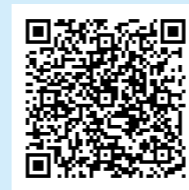
▲アプリの入手はこちらから(アプリは無料)

●全国版救急受診アプリ(消防庁作成アプリ「愛称「Q助」」) 急な病気やけがをしたとき、該当する症状などを画面上で選択していくと、緊急度に応じた必要な対応として「いますぐ救急車を呼びましょう」、「できるだけ早くに医療機関を受診しましょう」、「緊急ではありませんが医療機関を受診しましょう」または「引き続き、注意して様子を見てください」という文言が表示されます。ぜひ活用ください。