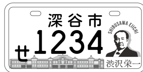
▲今回交付を開始する『渋沢栄一』デザインのナンバープレート

新1万円札の肖像に渋沢栄一翁が採用されたことから、さらに渋沢栄一を市内外にPRすることを目的に、『渋沢栄一』をデザインした原付バイクオリジナルナンバープレートを交付します。 なお、現在使用中のナンバープレートも『渋沢栄一』オリジナルナンバープレートに交換できます。 交付開始 9月17日(火)午前8時30分 交付場所 市民税課 対象車種 次の3車種 ・排気量 50cc以下＝白色 ・排気量 51～90cc＝黄色 ・排気量 91～125cc＝桃色 ※新規・交換いずれの場合も、3車種ともに1001から順次交付必要書類 ①新規登録＝販売証明書(譲渡の場合には譲渡証明書と廃車証明書)、印鑑、届け出者の本人確認書類(免許証、保険証など) ②交換＝現ナンバープレート、印鑑、標識交付証明書、届け出者の