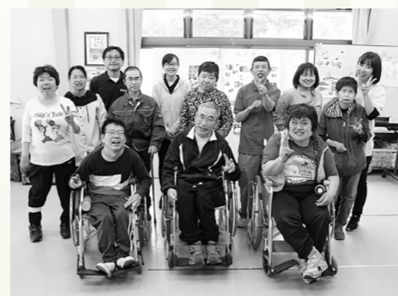
第2春日園利用者と職員の皆さん

食品加工班では、手作りにこだわったパンを販売しています。あんパンやクリームパンなど、素朴で昔ながらのパンを中心に、おすすめのパンを詰め合わせたプチパンセットや季節限定商品など数種類のパンを取りそろえています。中でも一番人気は、鮮やかな紅い色のラインが特徴の『紅いもパン』。道の駅かわもとや熊谷のティアラ21『わくわく広場』でも販売しているので、ぜひ一度味わってみてください。