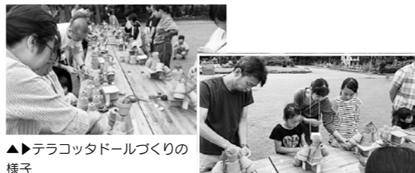
▲▶テラコッタドールづくりの様子