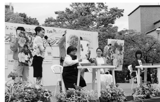
▲トークショー『花のある食卓のご提案～ブーケサラダ～』の様子

会場では、ガーデニング教室や花の展示をはじめ、花にまつわるトークショーなども行われ、花について観て、聞いて、体験するイベントとして大いににぎわいました。