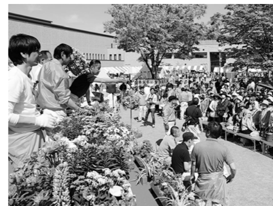
▲会場内を装飾していた花苗は『せり市』で販売されました

地域通貨導入に向けた実証実験のため、スマートフォンとカードを使用した『深谷市電子プレミアム商品券』が販売され、参加者は利用方法などについて熱心に耳を傾けました。