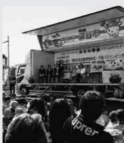
▲23日に行われた市民栄賞受賞式の様子

3月 10日：18日：深谷市親善大使の村岡桃佳さんが、平昌パラリンピックで金メダルを含む5つのメダルを獲得。23日に深谷市民栄賞受賞。