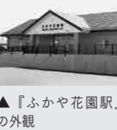
▲『ふかや花園駅』の外観