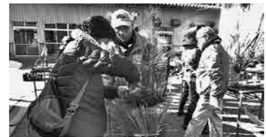
▲昨年行われた『門松づくり』の様子