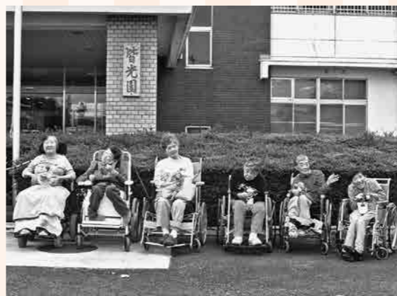
皆光園利用者の皆さん

『生活介護』とは、常時介護を必要とする障害者に対し、主に昼間に、施設での入浴や食事の介護、創作的活動や生産活動の機会を提供することです。『施設入所支援』では、入所者に対して主に夜間に入浴や食事の介護をするほか、生活などに関する相談・助言など必要な日常生活上の支援を行います。