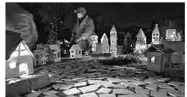
▲『あかり展』に向けて準備をします。