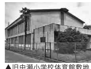
▲旧中瀬小学校体育館敷地