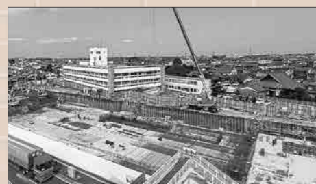
▲現在の工事の様子(10月18日撮影)

2次掘削工事が完了した東側部分から、基礎工事(配筋・コンクリート工事など)を開始しています。