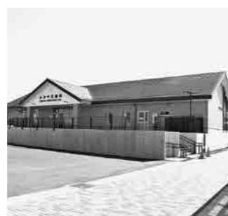
▲『ふかや花園駅』駅舎の様子。駅ロータリーには、駐輪場や市コミュニティバスくるリンの停留所も設置されています。

『ふかや花園駅』は、拠点内で運営が予定されている三菱地所・サイモン(株)のプレミアムアウト