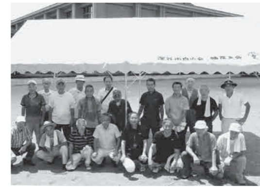
▲自治会連合会幡羅支会がテントを整備しました。

また、就学に際し、特に配慮を要するお子さんをお持ちのかたは、事前に問い合わせ先にご相談ください。 宝くじ助成でテントを整備 問 自治振興課(☎574-8597) 自治会連合会幡羅支会が、自治総合センターの実施している平成30年度宝くじ助成を受けました。