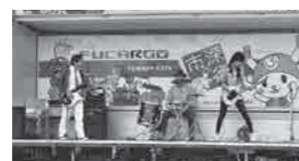
▲昨年の「花の音楽祭」の様子

申し込み・問い合わせ 7月18日(火)～8月31日(金)までに、応募用紙をファクス(☎574-8611)または直接深谷グリーンパークへ