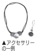
▲アクセサリの一例

『ガーデンシティふかや』『ふかや緑の王国』ホームページのほか、ツイッター(@garden551)、『ふかや緑の王国』フェイスブックもご覧ください。