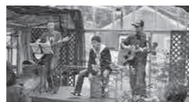
▲昨年の「森の音楽祭」の様子

申し込み・問い合わせ 7月18日(火)～8月31日(金)までに、応募用紙をファクス(☎551-5552)または直接ふかや緑の王国へ