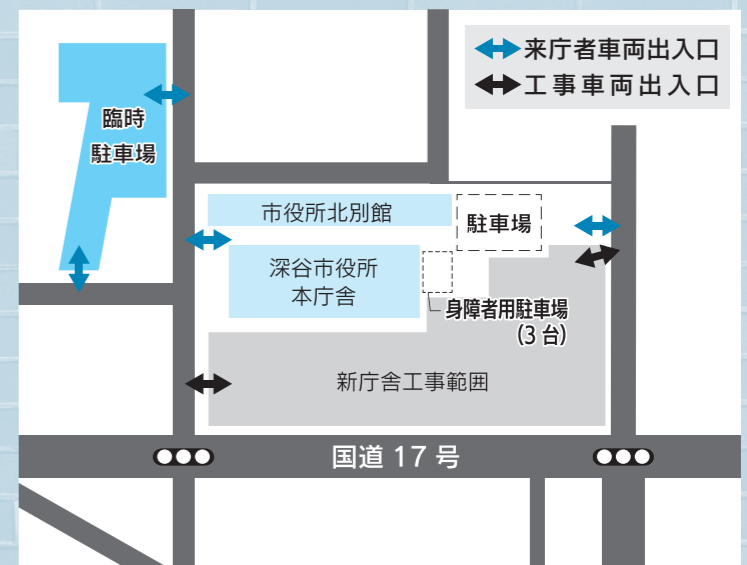
▲現在の駐車場や工事範囲の様子。

また、市役所周辺では、工事車両が頻繁に出入りしますので、ご来庁の際、また付近を通行する際は、十分ご注意ください。工事の影響で混雑なども発生する場合もあり、皆さんには大変ご不便をおかけしますが、ご理解とご協力をお願いします。