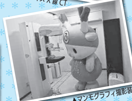
▲マンモグラフィ撮影装置

▲ここは女性が検査を受ける専用のお部屋のひとつだよお。ここではマンモグラフィ検査をすることができるんだってえ！女性の検査専用のフロアは、入口が違うから、安心して検査を受けることができるねえ。