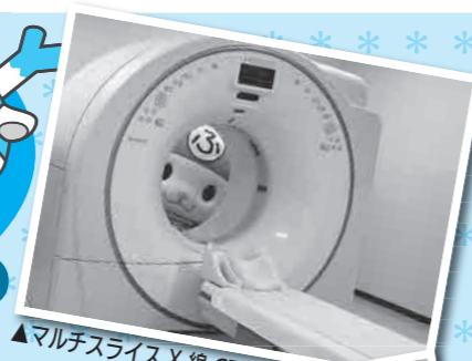
▲マルチスライスX線CT