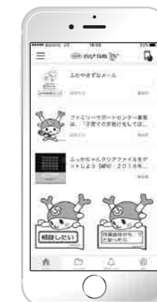
▲アプリ画面のイメージ図

▲ふかや子育てアプリのロゴマークです。アプリをインストールするには右のQRコードを読み取るか市ホームページ(☎『はぐたま』で検索)をご覧ください。