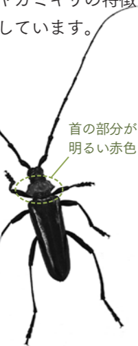
首の部分が明るい赤色

昭和初期に創刊された雑誌の表紙写真を展示します。時局の変化に伴う、写真への影響を、表紙を飾った女性の姿を中心に紹介します。