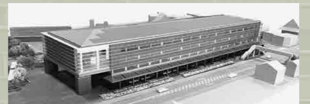
▲巡回展示する新庁舎の模型

藤沢公民館 公開中～5月11日(金)正午まで 幡羅公民館 5月12日(土)～25日(金)正午まで 明戸公民館 5月26日(土)～6月8日(金)正午まで ※以降のスケジュールは市ホームページでご確認ください。