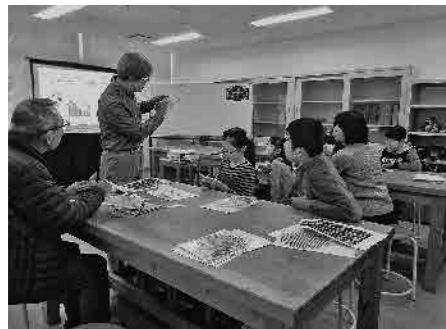
▲平成29年11月に行われた『折り紙のかがかで右脳をトレーニング』の風景。ドラゴンを折る際のコツを説明しています。

これからも子どもたちの『驚き』を大切に、子どもたちと科学の橋渡しをしていきます。