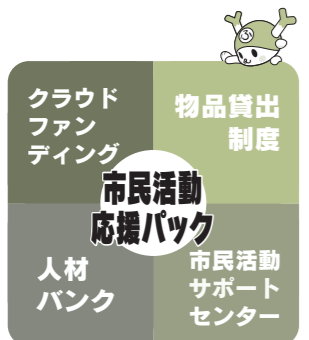
▲市民活動応援パックのイメージ。活動時にさまざまな面から支援します。

市民活動サポートセンターの登録団体を対象に、机やイス、テントなど50種類以上の市の物品を貸し出します。