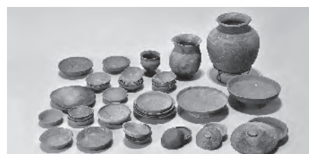
▲幡羅遺跡からの出土品