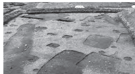
▲幡羅遺跡の発掘調査の様子。現在は、一面に畑が広がっています。