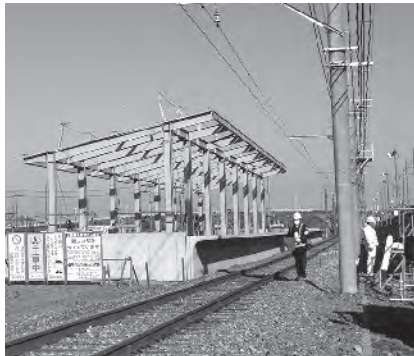
▲『ふかや花園駅』建設現場。平成30年10月20日に開業予定です。

かな交通対策ができるほか、誘致対象をアウトレットモールに限定することで、地域商店への影響を抑えることができます。