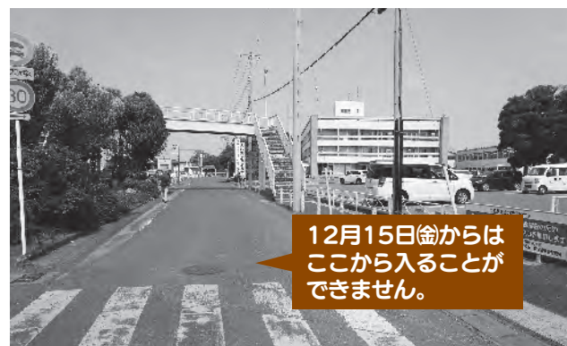
▲廃止になる市役所本庁舎南側の市道

皆さんには大変ご不便をおかけしますが、「ご理解とご協力をお願いいたします。」 なお、市コミュニティバス「くるりん」のバス停は、今まで通り利用できます。 また、市役所本庁舎南側のATM（現金自動預払機）は、平成30年2月中旬まで利用できます。