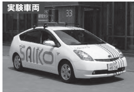
▲実証実験では、車体の内部や上部に、実験内容に応じたさまざまな装置を法律の範囲内で取り付けて自動運転を行います。実験は、時速10キロメートル程度の走行から始めます。

埼玉工業大学では、公道での自動車の自動運転実証実験を開始します。 この実証実験は、自動運転技術の研究開発を通して、活力あるまちづくりに貢献できる若者を一人でも多く育て、市の発展に貢献すること、さらに、市内外の企業や研究機関との連携を促し、自動運転車をはじめとした新たな移動サービスなど、深谷市のまちづくりに役立つ自動運転関連産業の育