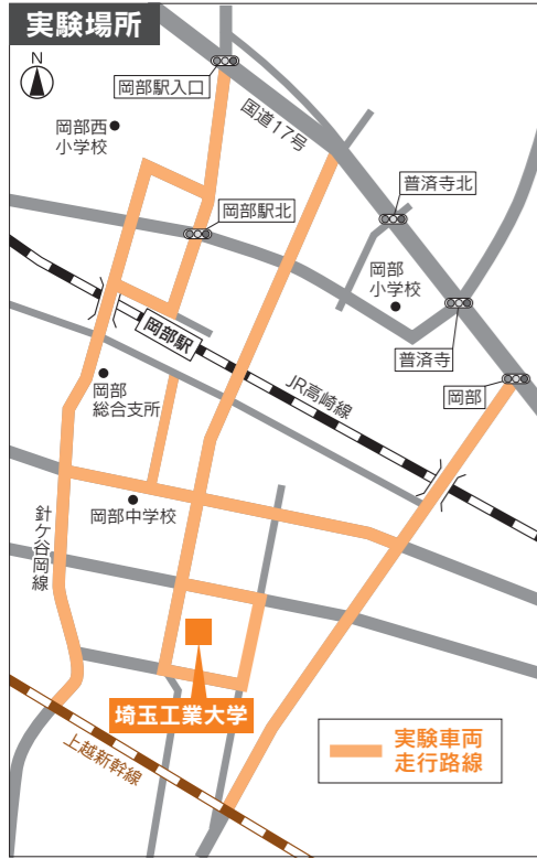
※実験車両走行路線は、実証実験の進捗状況によって、再度告知を行った上で、変更する場合があります。