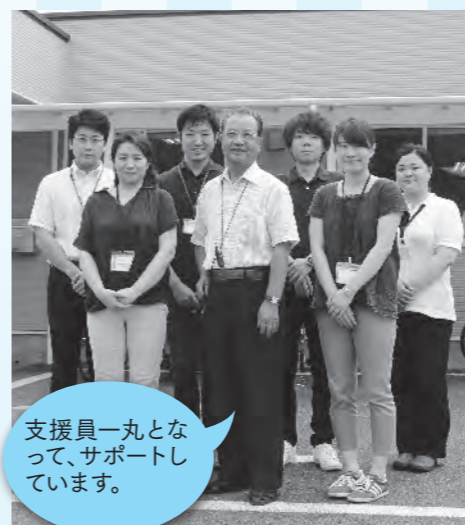
支援員一丸となって、サポートしています。

また、施設内での作業にとどまらず、一般企業に訪問して実習を行っており、毎年多くの利用者が企業に就職しています。