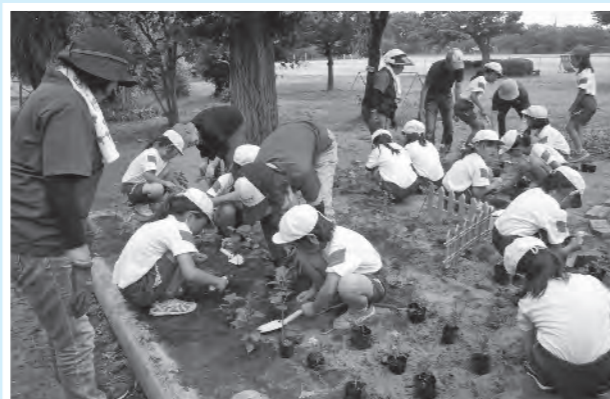
▲本郷小学校の児童がボランティアと学校花壇を整備しました。