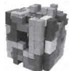
▲第8回人間審査の部最優秀賞作品

応募締切 9月30日(土)必着 ※最優秀賞(クオカード1万円分)をはじめ、優秀賞(同5,000円分)、特別賞(同2,000円分)あり