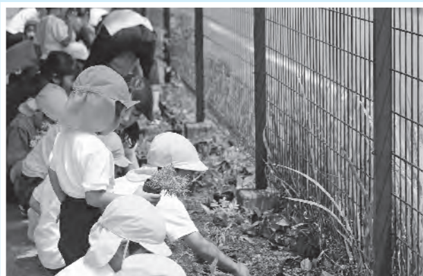
▲おかべ幼稚園の園児が花壇に花を植えました。

花はなプランとは、学校だけに子どもをお願いするのではなく、地域で将来の深谷を担う子どもを育てる環境を取り戻すため、子ども・学校・地域(ガーデニングボランティア・PTA・学校応援団など)が、一緒に花壇作りを行う活動です。