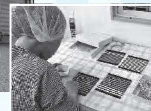
◀基盤に部品を乗せる様子。細かい作業も集中して行います。