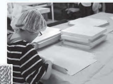
◀箱の組み立て作業。それぞれが得意な作業を手分けして進めています。