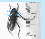
▲市内で発見されたクビアカツヤカミキリ ※首の部分(点線で囲んだ部分)が明るい赤色になっています。

成虫の体長は2～4cmくらいで繁殖力が強く、幼虫はクラ・ウメ・モモなどの樹木を食べるため倒木などの被害が出る恐れがあります。