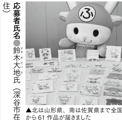
▲北は山形県、南は佐賀県まで全国から61作品が届きました

問 図書館 (☎571-8210) 深谷市イメージキャラクター『ふっかちゃん』を題材にした絵本で、深谷市が実施するブックスタートにふさわしい作品を募集した『ふっかちゃんブックスタート』で大賞作品が決定しました。 作品名 ● 『ふっかちゃんとおそぼ』