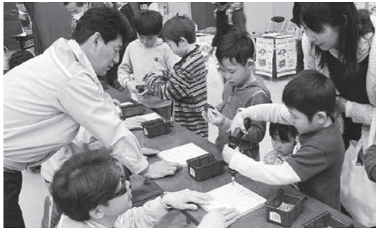
▲第1回深谷ものづくり博覧会の様子