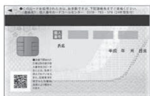
▲個人番号カード(裏)

【申込方法】 昨年末にお届けしたマイナンバー(個人番号)記載の通知カードには、「個人番号カード交付申請書」が付いています。