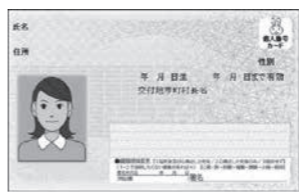
▲個人番号カード(表)