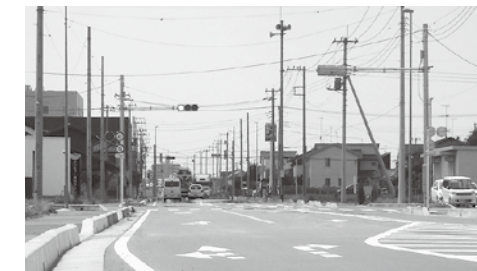
▲『駅通り工場団地線』のうち、今回開通した区間の付近の様子