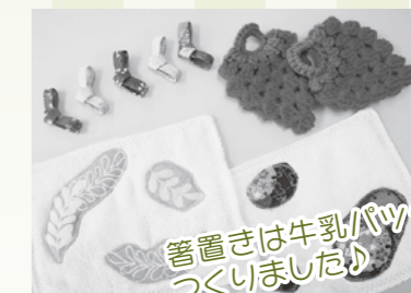
箸置きは牛乳パックでつくりました!

熊谷産地粉100%、北海道産アズキ、秩父みそ、深谷ねぎなど原材料にこだわった手作りのおいしいまんじゅうです。/1個100円、3個入り300円