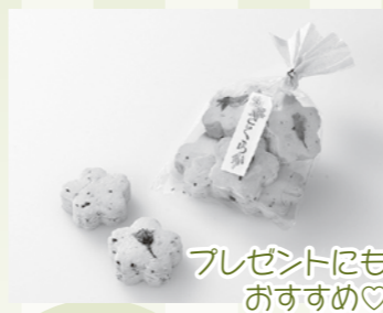
プレゼントにもおすすめ♡

授産製品とは、障害のあるかたが作っている商品です。商品の他に作業なども提供しています。どれも高品質なものばかり!このコーナーではその一部を紹介します。