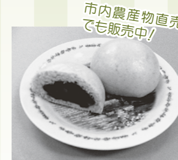
市内農産物直売所でも販売中!

季節限定!桜の形で♡桜の葉を生地に練り込み、季節を感じるクッキーです!ぜひ、ご賞味ください。/1袋200円