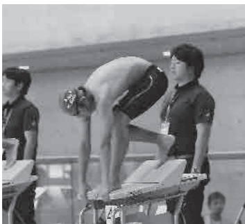
▶昨年8月、第39回関東中学校水泳競技大会(東京辰巳国際水泳場)の様子