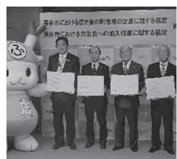
▲『空き家の利活用の促進に関する協定』、『自治会への加入促進に関する協定』の締結式は1月28日に市長公室で行われました

1月28日に自治会加入を促進するため、『自治会への加入促進に関する協定』を締結しました。 今後転入希望者に向けて、協定した不動産業者などが自治会加入促進チラシを配布します。 協定先 深谷市自治会連合会、(公社)埼玉県宅地建物取引業協会埼玉北支部、(公社)全日本不動産協会埼玉本部大宮支部