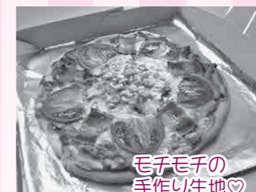
モコモコの 手作り生地♡