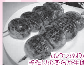
ふわふわ! 手作りの柔らか生地

授産製品とは、障害のあるかたが作っている商品です。商品の他に作業なども提供しています。どれも高品質なものばかり! このコーナーではその一部を紹介しします。