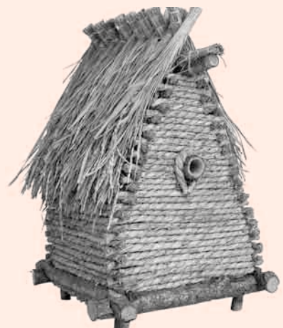
最優秀賞 いとうけんいち 伊藤健一 『稲穂の館』