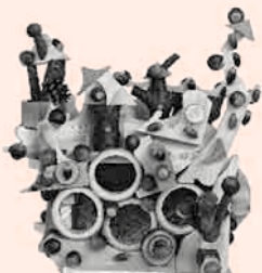
優秀賞(小学生以下) かねた かほめ 金田 要 『どんぐりハウス』