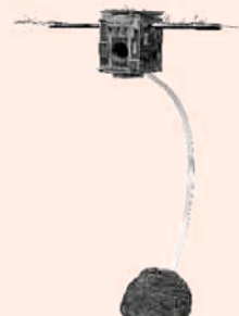
優秀賞(一般) しんどうしげお 進藤重男 『大空へ』