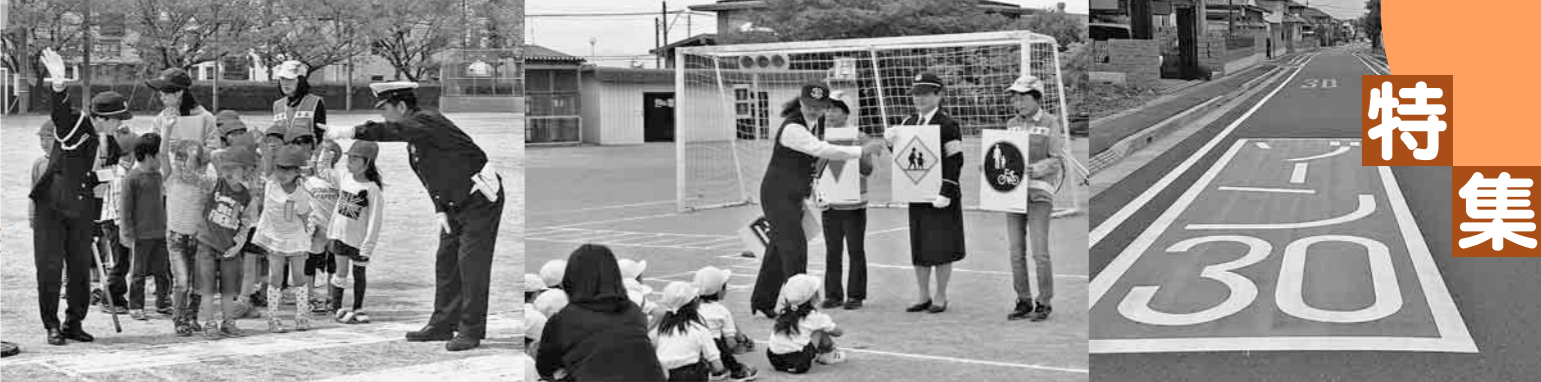
▲深谷市交通指導員・交通安全母の会・深谷警察署による『交通安全教室』(左/深谷小学校、右/八基小学校) ▲生活道路対策『ゾーン30』(岡里地区)ほか