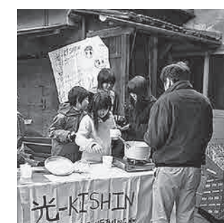
▲にぎわいた市では、子どもたちが創意工夫しながら、お菓子を販売したり英語劇を行ったりしています

特に大切にしてきた活動は、地元の子どもたちとの交流です。七ツ梅酒造跡で行われている『にぎわいた市』では、光-INSHINならではの視点も取り入れながら、子どもたちの自由闊達な活