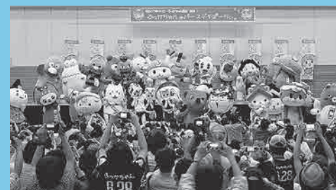
▲全国から約13,000人のファンが集まり、ふっかちゃんの誕生5周年をお祝いしました