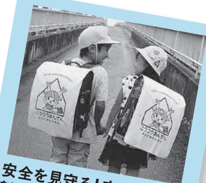
安全を見守る!市内小学校 新1年生のランドセルカバー 深谷・寄居地区交通安全協会では、 ランドセルカバーのデザインにふっ かちゃんを採用し、市内の新1年 生全員に配布しています。