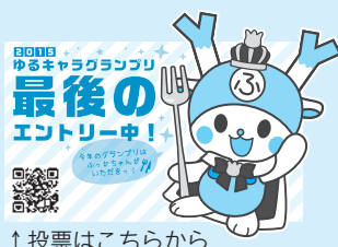
↑投票はこちらから

昨年は惜しくも準グランプリ(第2位)でしたが、今年にはふっかちゃんの最後の挑戦として、グランプリを目指します。深谷が元気でいっぱいになるよう皆さんの応援をよろしくお願いします。 投票期間 ● 8月17日(月)午前10時~11月16日(月)午後6時(毎日投票できます) 中間発表 ● 9月23日(祝) 決戦投票 ● 11月21日(土)~23日(祝) 投票方法 ● パソコンやスマートフォン、携帯電話などによる投票 詳しくは、『ゆるキャラグランプリ』公式ホームページ (IP『ゆるキャラGP』で検索)をご覧ください。