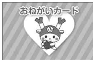
▲持っているかたを見かけたら支援をお願いします

福岡福祉政策課(☎568-5041)市では、障害のあるかたなどが、いざという時に、手助けをしてもらいたいことなどを伝えるのに役立つ『おねがいカード』を作成しました。『災害時要援護者(避難行動要支援者)のための防災マニュアル』に掲載されているほか、市ホームページからダウンロードできます。