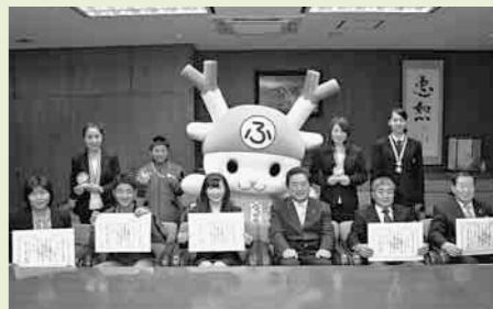
▲3月19日に市長公室でスポーツ栄誉賞授与式が行われました