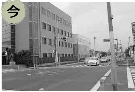
▲左が交通機動隊北部方面隊の建物、右が教育研究所・ボランティアセンター

労働保険料および一般拠出金の申告・納付 問 埼玉労働局労働保険徴収課 (☎048-6000-6203) 平成27年度の労働保険(労災保険・雇用保険)年度更新および石綿健康被害救済法の一般拠出金の申告・納付は、6月1日(月)〜7月10日(金)までです。今月末に郵送される申告書・納付書で手続きを行ってください。