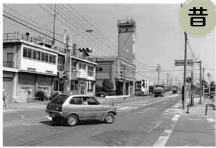
▲左が当時の深谷警察署、右が深谷消防署