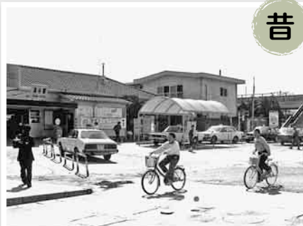
▲平屋建ての旧駅舎

計量器定期検査の事前調査に ご協力ください 開都計画課(☎574-6650) 計量法の規定により、2年に1度、 事業所などで取引や証明に使用して いる計量器の定期検査が実施されま す。6月の検査実施に先立ち、対象