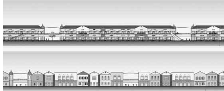
▲立面イメージ(三菱地所・サイモン株式会社提案図面)

花園インターチェンジ拠点整備プロジェクトの民間ゾーンにアウトレットモールを核とする観光型集客施設を建設・運営する民間事業者を選定するため、募集要項を公表し、募集を行ったところ、2社からの応募がありました。 選考委員会による審査を経て、優先協議者は三菱地所・サイモン株式会社に決定しました。 今後、選定された民間事業者と、事業契約の締結を目指して、プロジェクトの諸条件などの詳細について、協議・交渉を行ってまいります。 問い合わせ 産業拠点整備室(☎5080-5002)