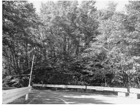
▲復興事業で整備された村道

【売却物件】 土地の所在 西島町2-12-1 (JR深谷駅北) 地目および地積 宅地1170.43㎡ 建物の種類 庁舎(鉄筋コンクリート造3階建・1165.59㎡) 倉庫(コンクリートブロック造平屋建・129.43㎡) 問い合わせ 財政課(☎574-6036)