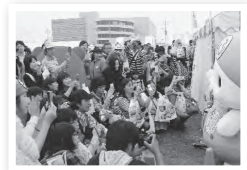
▲11月1日～3日開催の『ゆるキャラグランプリ2014 in あいち セントレア』でも、ふっかちゃんは大人気!

今や、市内・市外を問わず活動の場を広げ、『深谷』というまちを知るための入り口としての役割も果たしています。