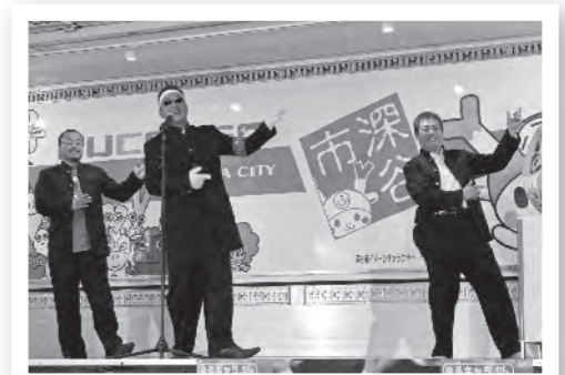
▲深谷ベースで行った『ゆるキャラグランプリ出陣式』では、商店街の方々による応援で大盛り上がり!

また、今年の『ゆるキャラグランプリ』では、行政だけでなく、市民や企業・団体が一緒になって、『オール深谷』として、ふっかちゃんを応援することができました。ふっかちゃんは、深谷市民共有のイメージキャラクターとして、『市民の一体感』を生み出すことにも一役買っているのです。しかし、ふっかちゃんの活躍で得られたものはそれだけではありません。例えばその一つが、『ふっかちゃん子ども福祉基金』です。