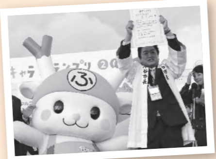
▲11月3日に行われた表彰式の様子

今年の『ゆるキャラグランプリ』では、皆さんからの応援に支えられ、見事準グランプリを獲得することができました。たくさんの温かい応援に感謝いたします。本当にありがとうございました!