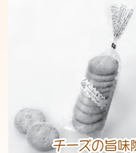
チーズの旨味際立つ!!

味噌だれが自慢です♪駅前福祉館(西島町)、リセット(人見)でも販売しています。/1串150円