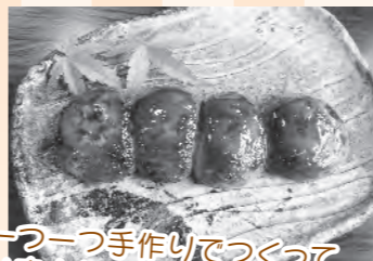
一つ一つ手作りでつくっています♪

授産製品とは、障害のあるかたが作っている商品です。高品質で真心がたっぷり詰まったものばかり。このコーナーではその一部を紹介합니다。