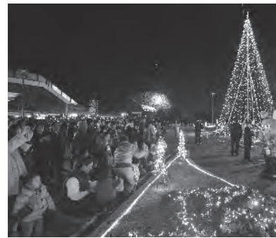
▲昨年の点灯式の様子。今年は12月上旬に点灯式を行い、平成27年1月末まで楽しむことができる予定です。

毎年12月になると、JR岡部駅の南側がイルミネーションで彩られ、地域の方々を楽しませていきます。このイルミネーションの企画から設置までを行うのが、「OKABE光の回廊プロジェクト」です。埼玉工業大学の学生が「がんばる！学生プロジェクト」として、何か地域のためにできないかという強い思いと共に始めたこの活動は、今年で5回目を迎えます。 このプロジェクトの特徴は、何と言っても「ふかや市商工会青年部(以下、青年部)との協働」です。例えば、イルミネーションで使う金型や仕掛けのほとんどは学生の手作りで、大学で学んだ電気や機械の知識を生かして制作しますが、学生だけでは実現できないことも。そこで力を発揮するのが青