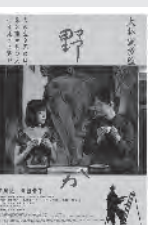
0000円・要電話予約、③休映

● チョコレートナッツ (米・97分・字幕) とき ● 9月6日(土)～7日(日) ④ 13日(土)④ 内容 同性愛カップルとダウン症の少年との心癒す美話 ● WOOD JOB! (ウツメン) 褪去な日々(日本・116分) とき ● 9月6日(土)～7日(日)④ 内容 都会育ちの青年が林業の世界で大奮闘 ● ぼくたちの家族 (日本・117分) とき ● 9月7日(日)～13日(土)④ 内容 余命無き母をめぐる家族の関係がたどる絆の混迷と再生の物語 ● 世界の果ての通学路 (仏・77分・字幕・ドキュメンタリー) とき ● 9月14日(日)～20日(土)① 内容 4つの異なる地域で長距離通学する子どもたちの姿を追った記録 ● 野のなななか (日本・171分) とき ● 9月14日(日)～20日(土)③④、(14日)②は、大林監督トーク付き②