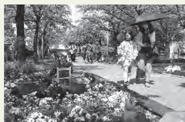
ガーデニングコンテスト各部門の最優秀賞決定!