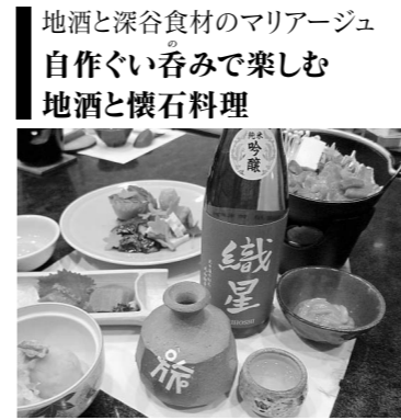
地酒と深谷食材のマリアージュ 自作ぐい呑みで楽しむ 地酒と懐石料理