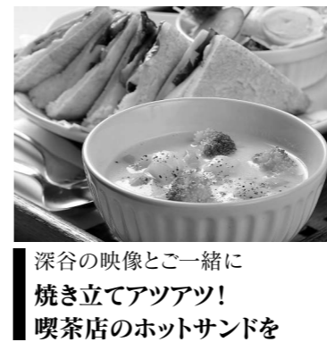
深谷の映像と一緒に 焼き立てアツアツ! 喫茶店のホットサンドを