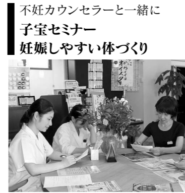
不妊カウンセラーと一緒に 子宝セミナー 妊娠しやすい体づくり