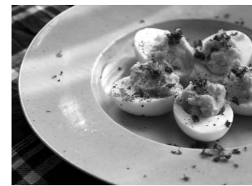
子どもから大人まで楽しめる 特製マヨネーズづくり& カフェ・ルックでランチ