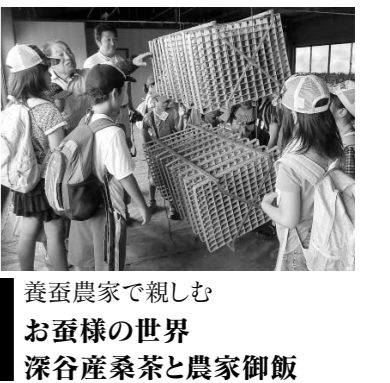
養蚕農家で親しむ お蚕様の世界 深谷産桑茶と農家御飯

FUKAYA BASE 深谷ベース 旧中山道にある群馬銀行深谷支店から西へ約50mのところ(深谷町地内)に、コンテナをモチーフとした新しい公共施設が出来ました。まちなかににぎわいを創出することを目指し、市内の産業の振興と深谷全体の新しいコミュニティのスタイルを提案するための活動拠点です。 利用を希望する場合は事前予約が必要ですが、料理教室やギャラリー展示など、さまざまなイベントに活用できます。 ▲写真はイメージです