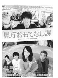
県庁おもてなし課

定期上映時間 ① 午前10時30分 ② 午後1時30分 ③ 午後4時30分 ④ 午後7時30分 通常料金 1,000円 問 NPO市民シアター・エフ(☎571-4566) ※火曜日定休 旅立ちの鳥唄 十五の春 (日本・114分) とき 8月4日(日)～10日(土)①②③ 内容 離島で育った中学生の少女が、卒業までの一年で経験する家族や友人との交流の物語 二郎は鮎の夢を見る (米・82分・ドキュメンタリー) とき 8月4日(日)～10日(土)④ 内容 5年連続ガイド本3つ星獲得の職人に米国人監督が迫るドキュメント この空の花 長岡花火物語 (日本・160分) とき 8月18日(日)～25日(日)① 内容 平和への願いを花火に込めて贈る感動ファンタジー 県庁おもてなし課 (日本・123分) とき 8月18日(日)～25日(日)②③④ 内容 地域活性化のため、美民間女子の協力を得て張り切る若き県職員純情